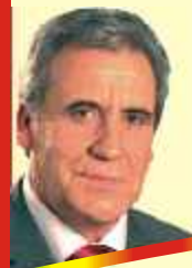
Jerónimo de Sousa Secretário-geral do PCP

À beira da votação de domingo, quero dirigir-lhe um último apelo.